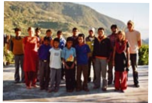
Projektdeltagare i byn Gwar, norra Indiens Himalaya.